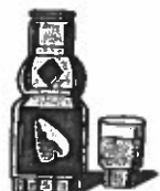
el zumo de fruta